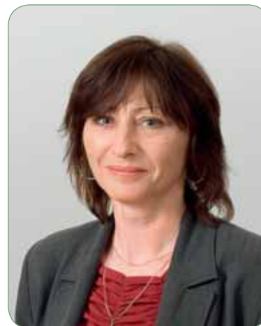
JUDr. ELIŠKA VOLFOVÁ vrchní ředitelka pro úsek provádění důchodového pojištění